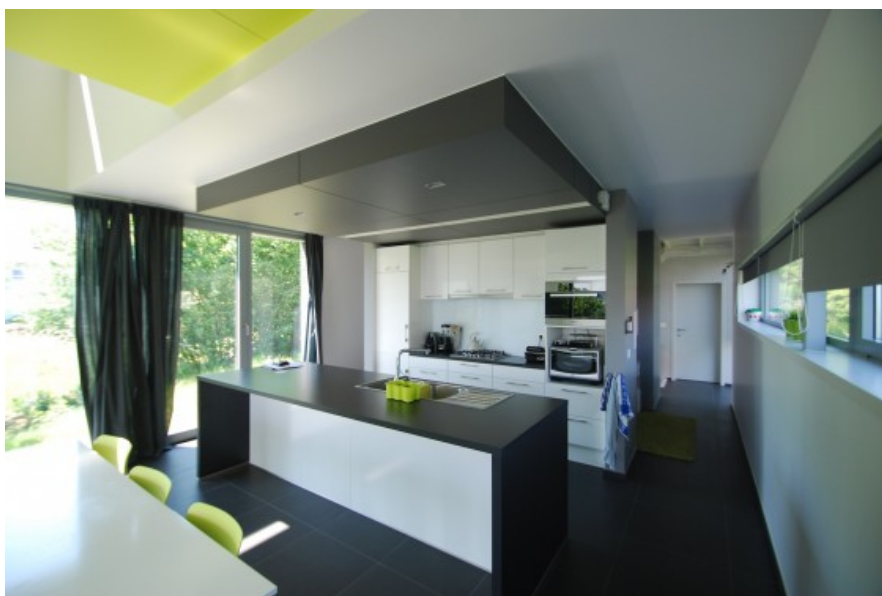
Â© SECHEHAYE Architecture & Design