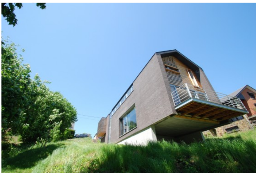
Â© SECHEHAYE Architecture & Design