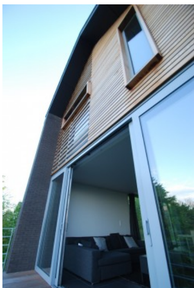
Â© SECHEHAYE Architecture & Design