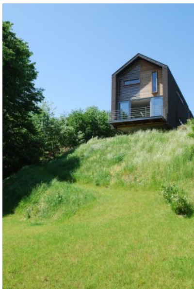
Â© SECHEHAYE Architecture & Design