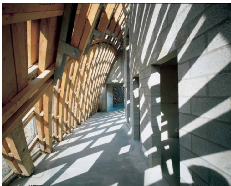
PROJET : SAMYN and PARTNERS © Samyn et Associés sprl