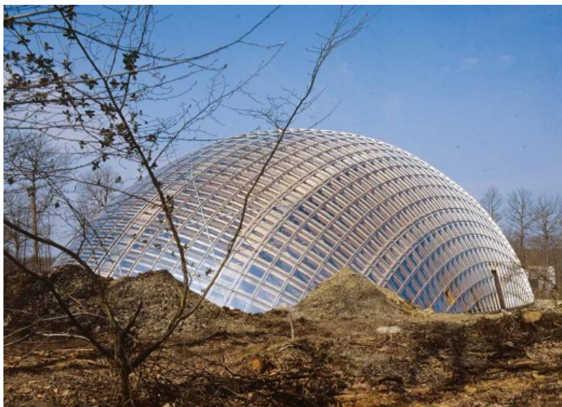
PROJET : SAMYN and PARTNERS Â© Samyn et Associ s sprl