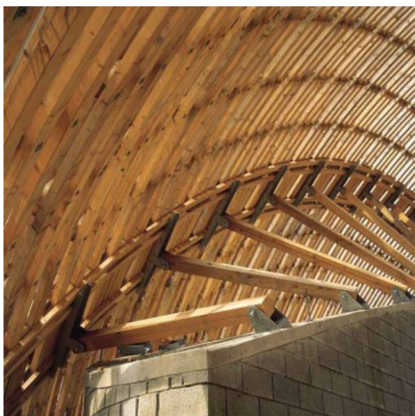
PROJET : SAMYN and PARTNERS Â© Samyn et Associ s sprl