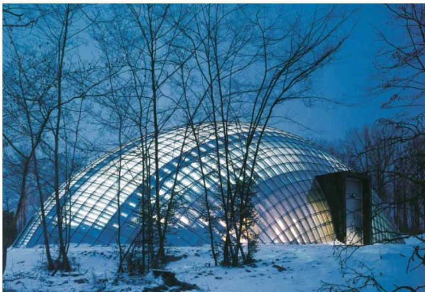
Project : Philippe SAMYN and PARTNERS PROJECT : Philippe SAMYN and PARTNERS / PHOTO : Daylight Liège sprl © Samyn et Associés sprl