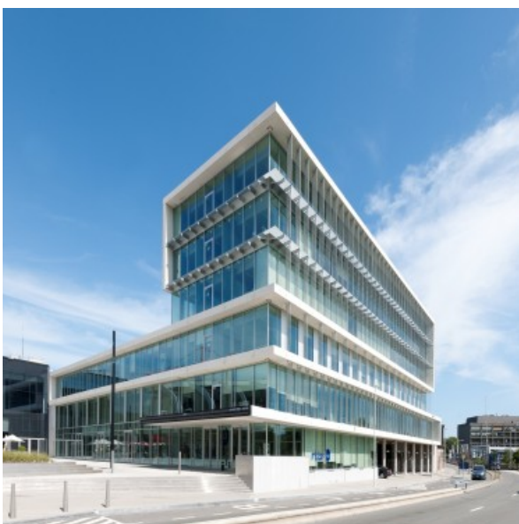
À© Georges De Kinder

CENTRE DE RECHERCHE PFIZER - 2009 2011 - Louvain-La-Neuve