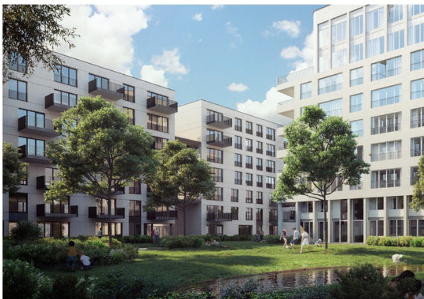
Â© Urban Platform