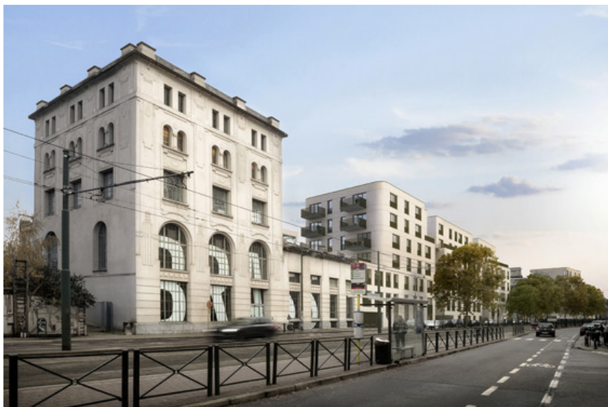
Â© Urban Platform