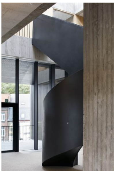
Â© Vers plus de bien-être V+