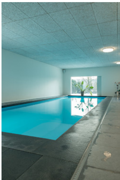
Photography : Pedro Correa Â© atelier d'architecture mathen