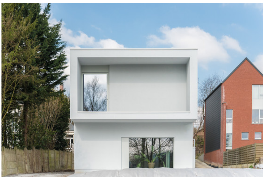
Photography : Pedro Correa Â© atelier d'architecture mathen