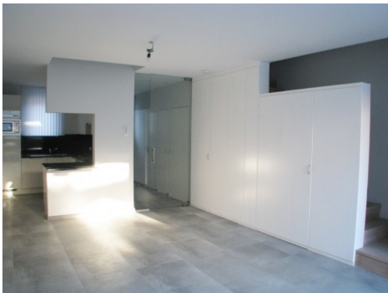
Vue intérieure - living - escalier vers étage